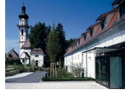
Kulturhaus Schloss Großlaupheim