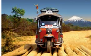
Bemsel & Snaider: Die große Reise