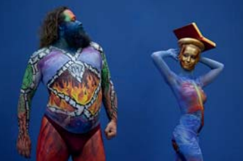
Laupheimer Fotokreis, Hans Heller